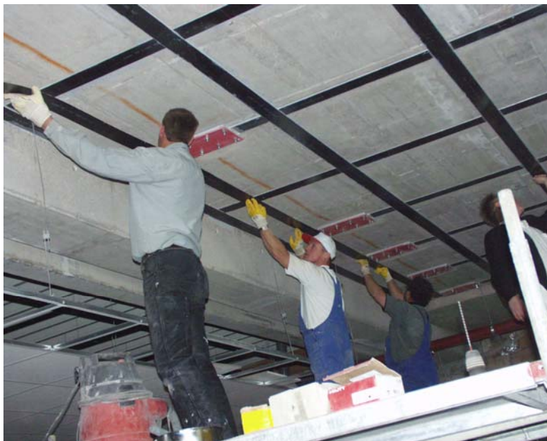
Bild 2. Ausführung der Verstärkungsmaßnahme

Zur Verstärkung des Deckensystems und der Unterzüge kamen schließlich 23 S&P Spannglieder mit je einer CFK-Lamelle 120 x 1,2 mm und einer Vorspannkraft von 120 kN zur Ausführung. Die Lamellen wurden mit 6 ‰ vorgespannt, im Grenzzustand der Tragfähigkeit können die Lamellen bis zu einer Dehnung von 10 ‰ ausgenutzt werden. Zur Verbesserung der Quertragfähigkeit und zur Abdeckung örtlicher Beanspruchungen wurden zusätzlich schlaaffe Lamellen appliziert. Bild 2 zeigt die Verstärkungsmaßnahme während der Ausführung.