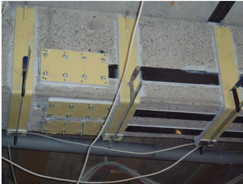
Bild 3. Verankerungsplatten und Stahllaschenbügel am Unterzug

Wegen der hohen Beanspruchung durch die Deckenlasten musste neben der Biegetragfähigkeit auch die Querkrafttragfähigkeit der Unterzüge erhöht werden. Hierzu wurde gemäß der allgemeinen bauaufsichtlichen Zulassung für schubfest angeklebte CFK-Lamellen eine Verstärkung mit angeklebten Stahllaschenbügeln gewählt, die nach dem Vorspannvorgang eingebaut wurden (Bild 3).